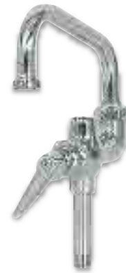
Add-on Faucets for use with Pre-Rinse Units Robinets pour l'usage avec les ensembles de pré-rinçage