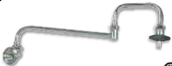
Pot & Kettle Filler Remplisseur à la marmite et à la bouilloire